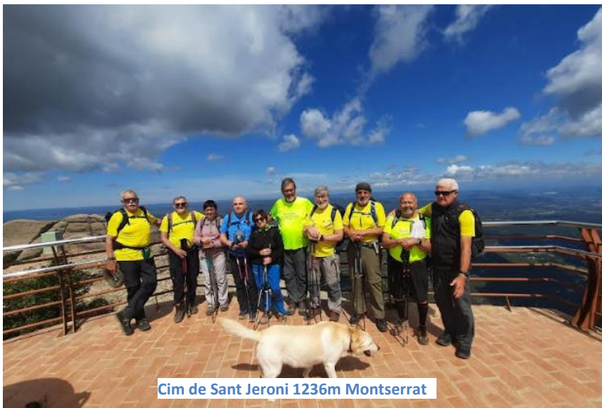
Cim de Sant Jeroni 1236m Montserrat

https://ca.wikiloc.com/rutes-senderisme/montserrat-albarda-castellana-sant-jeroni-i-ermita-de-sant-jeroni-des-de-vinya-nova-collbato-171606660?utm_medium=app&utm_campaign=share&utm_source=2558918